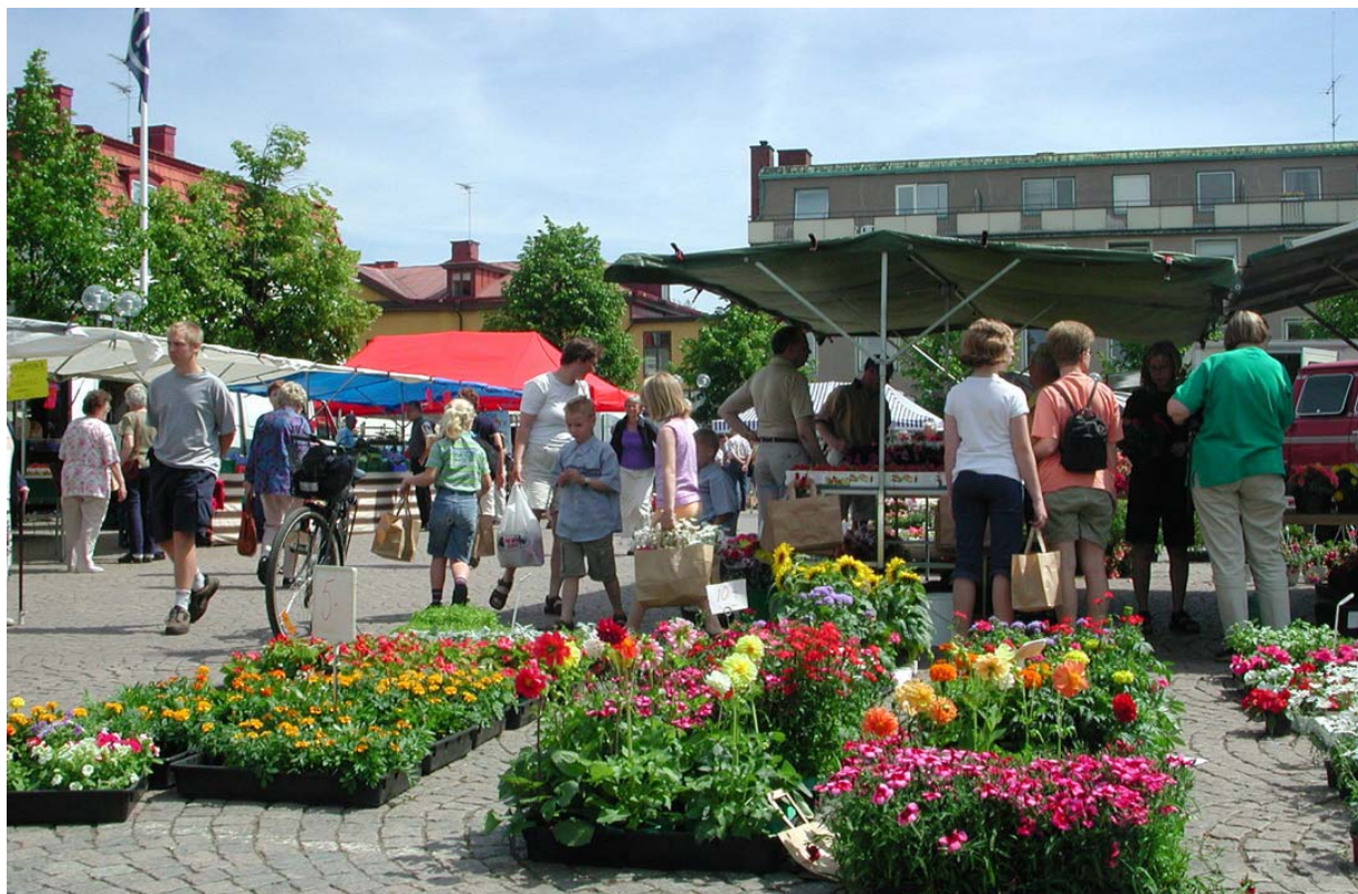
Torget är ett av stadens vardagsrum

har åter hamnat i fokus som motor för samhällsutvecklingen. Ingen stad är den andra lik, även om de har många gemensamma drag med varandra. Strategier som är lämpliga i en stad behöver inte vara bra i en annan. För det andra ser inte städer ut idag som de en gång gjorde. De består numera inte bara av den gamla innerstaden utan av stadsbygden som helhet, med alla dess olika områden för boende, handel, rekreation, industri, vård och transporter.